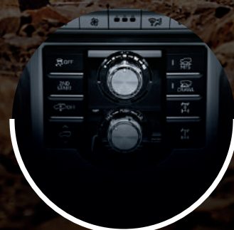
MULTI TERRAIN SELECT* (4 CÁMARAS)