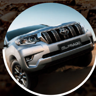
SISTEMA CRAWL CONTROL*

SI ERES AMANTE DEL OFF ROAD TAMBIÉN CUENTAS CON ESTAS OPCIONES: